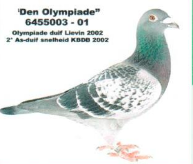
'Den Olympiade' 6455003 - 01 Olympiade duif Liévin 2002 2° As-duif snelheid KBDB 2002

M:2007/6387872 Dochter van 'Het Dreampair'